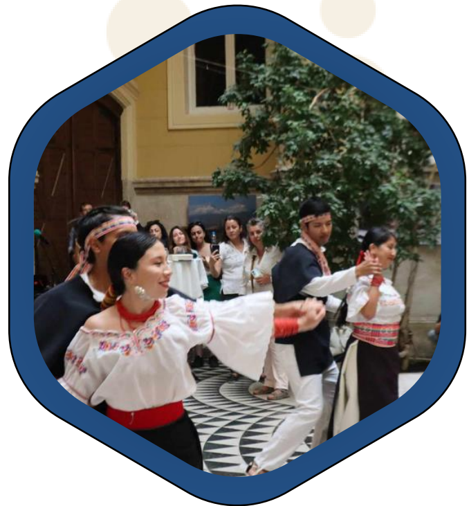
Nagykövetségek, kulturális intézetek

Meglévő kapcsolatos erősítése, intézményesítése, új alapokra helyezése; új partnerségek felkutatása