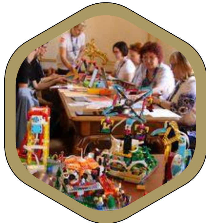
Hazai szakmai együttműködések * Innováció