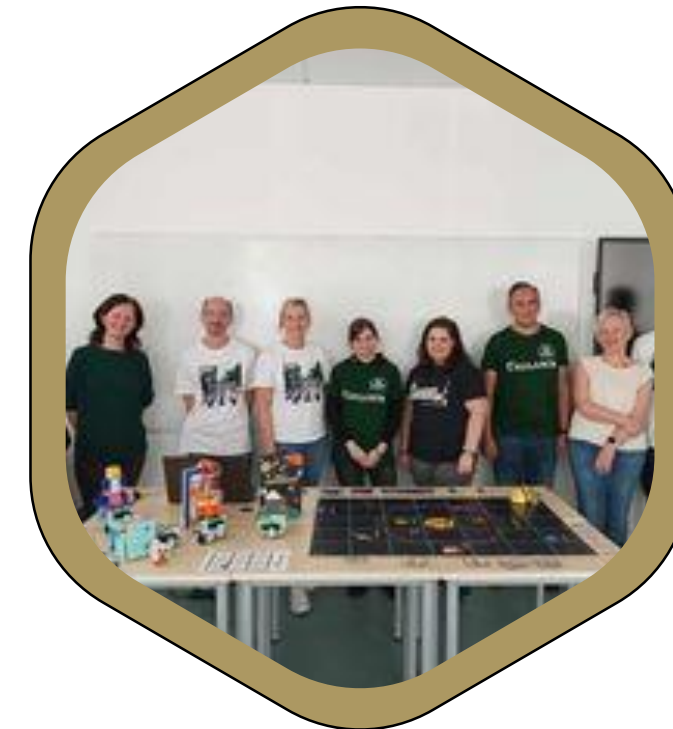
Hazai szakmai együttműködések * Robotika