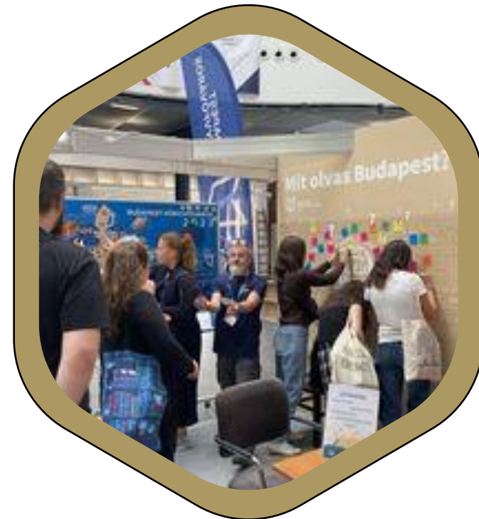
Szervezetben belüli együttműködések