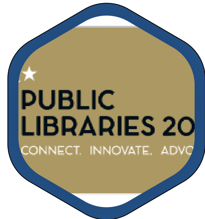
Nemzetközi szakmai együttműködések