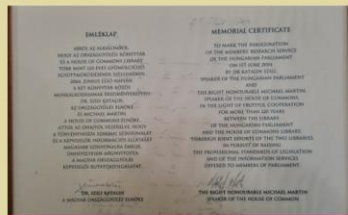
2024.11.09. XII. Évfolyam 5. szám Ötágú síp

Az 1935-ben alapított Magyar Könyvtárosok Egyesülete jelenleg mintegy 2300 fős a tagsággal rendelkezik, akik 28+3. részben működési hely szerint szerveződő területi (általában megyei), részben