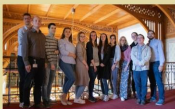
2024.11.09. XII. Évfolyam 5. szám Ötágú síp