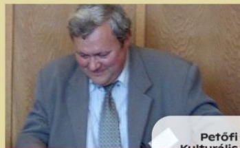
2024.11.09. XII. Évfolyam 5. szám Ötágú síp

Évfordulók 50 éve, hogy kezdő műszaki könyvtárosként a Magyar Könyvtárosok Egyesületének tagja lettem, egy jó kolléga tanácsára. Ezalatt a fél évszázadnyi idő alatt a „mezei tagsági” viszonytól az aktív szolgálattevő...