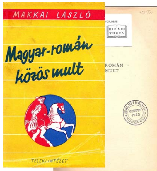
A Teleki Intézet 1948-as kiadványa az egykori Genfi Magyar Könyvtár 1943-as bélyegzőjével