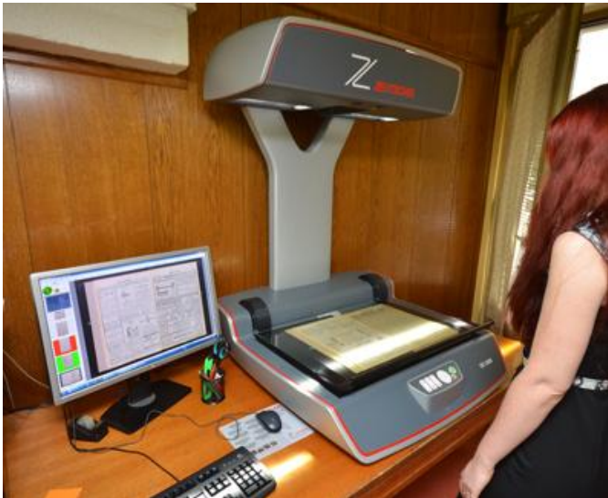
Digitalizálás a Szabadkai Városi Könyvtárban