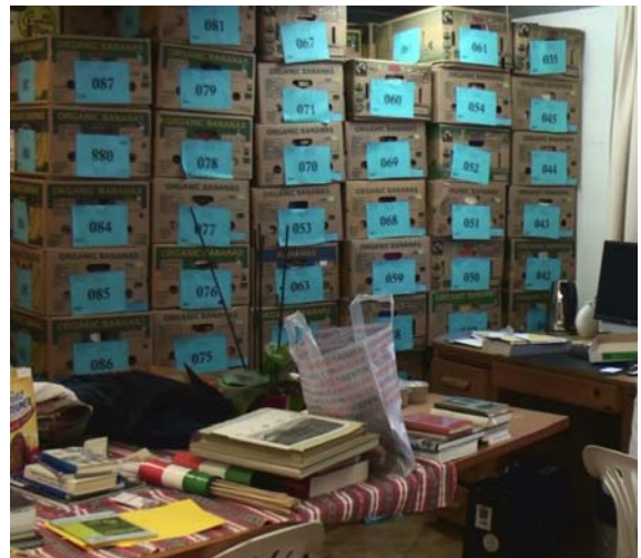
Az állomány egy része Csenger városába kerül, ahol a szatmári térség kulturális életét fogja gazdagítani