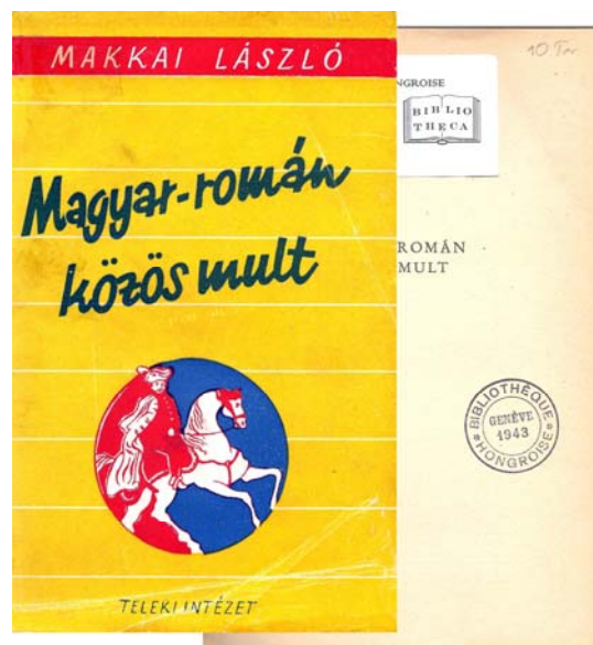
A Teleki Intézet 1948-as kiadványa az egykori Genfi Magyar Könyvtár 1943-as bélyegzőjével