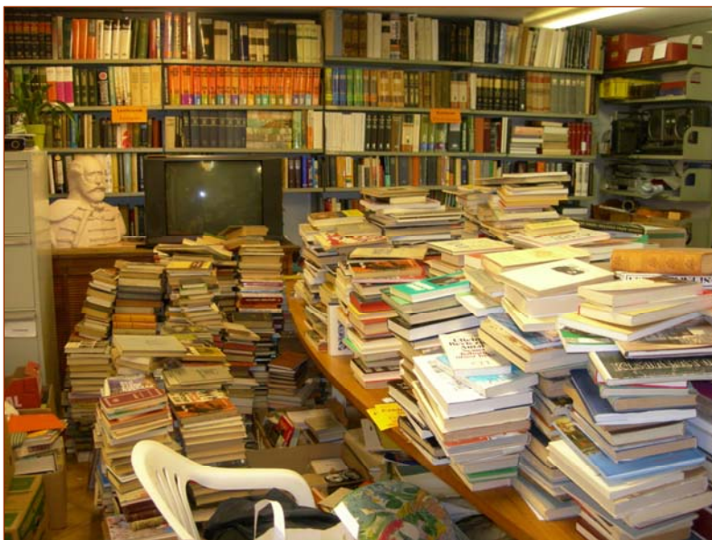
Néhány hete még harmincezer kötet várt válogatásra, címkézésre, rendezésre és egy részük kiselejtezésre

Földrajz, életrajz, történelem. Honismeret, expedíciók, útleírások, útkönyvek; életrajzok; lovagrendek; ókori történelem, az első világháború és a két világháború közötti időszak története, 1956 történelme, stb.